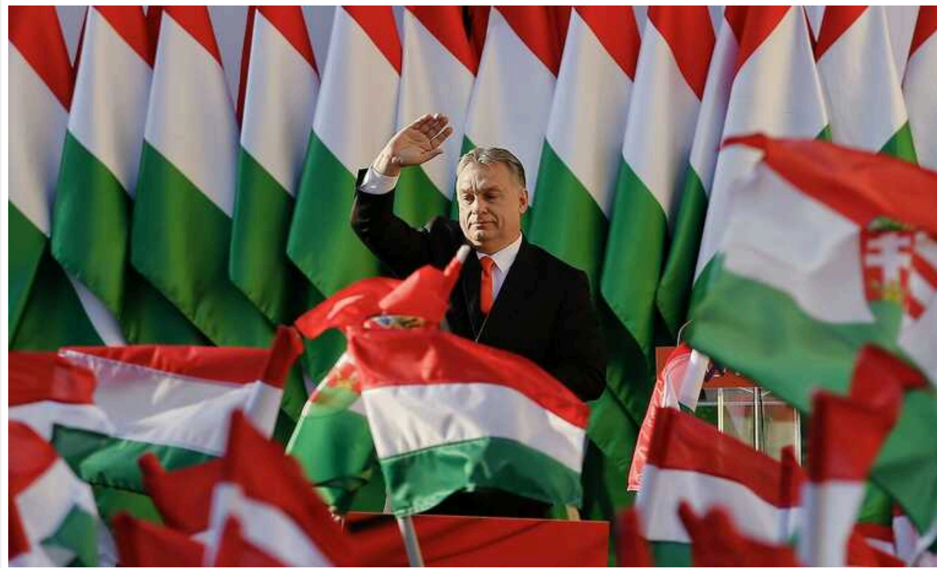
Партія прем'єра Орбана стала найбільшим рекламодавцем Google в Євросоюзі

Рівень витрат на політичну рекламу в Інтернеті в Угорщині є високим навіть за європейськими стандартами.