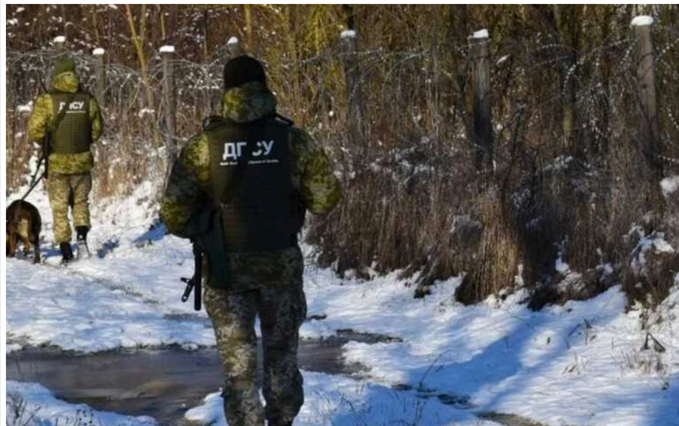
Що загрожує українцям за спробу незаконного перетину кордону

Під час воєнного стану в Україні заборонено виїзд за кордон для чоловіків від 18 до 60 років. За спробу незаконного перетину кордону передбачена адміністративна та кримінальна відповідальність. За порушення закону можна отримати штраф до 8 500 грн або адміністративний арешт на строк до 15 дів, а також позбавлення волі від 2 до 5 років за підробку документів або ухилення від мобілізації.