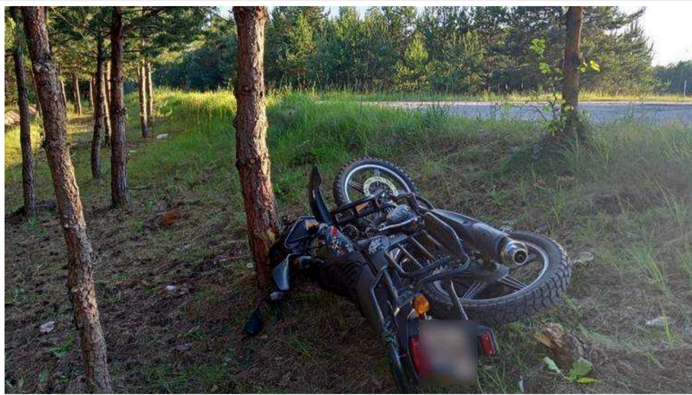
У ДТП на Рівненщині загинув 18-річний мотоцикліст із Волині

Між селами Маюничі Рівненської області та Мала Осниця Волинської області сталась ДТП за участі 18-річного мотоцикліста. Хлопець врізався у дерево, внаслідок отриманих травм він помер у лікарні.