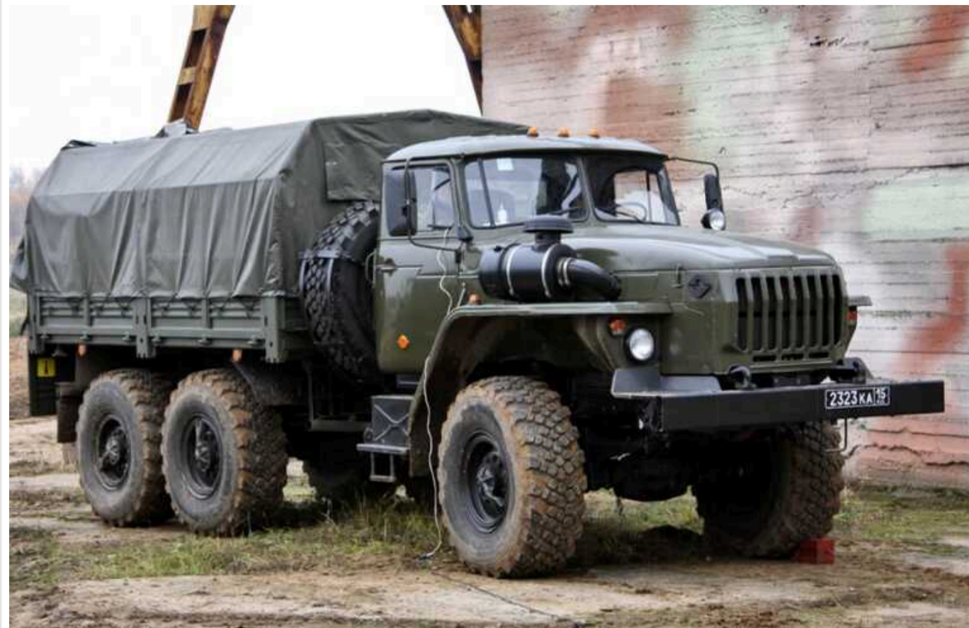
В окупованому Луганську росіяни на «Уралі» збили двох підлітків

Російські військові збили двох підлітків у центрі тимчасово окупованого Луганська. Інцидент стався увечері 6 червня.