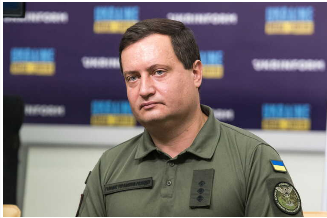
ГУР розкрило нові подробиці атаки на Су-57 в РФ

Читати на руском Read in English Додати як бажане джерело в Google