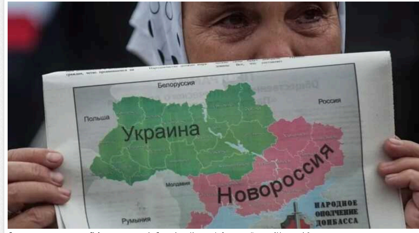
Окупанти знову хочуть об'єднати окуповані області та Крим у федеральний округ "Новоросія"

Держава-агресорка Росія планує об'єднати окуповані території чотирьох регіонів України та Крим в один федеральний округ. Назвати його в Москві планують у кращих традиціях російської пропаганди - "Новоросія".