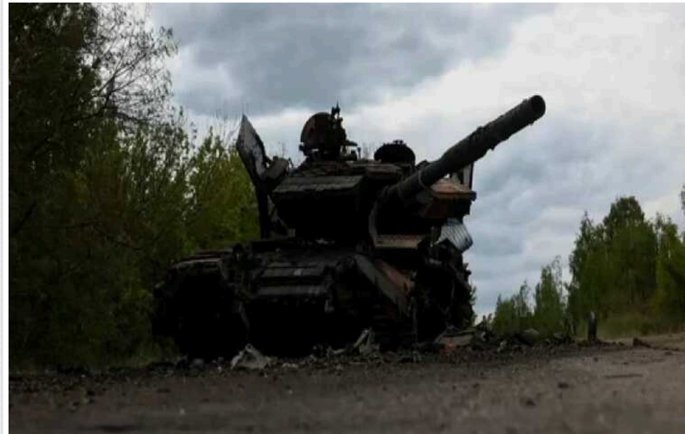
ISW не підтверджує вхід українських військ до села Глибоке Харківської області

Раніше про це згадували російські та українські військові Телеграм-канали.