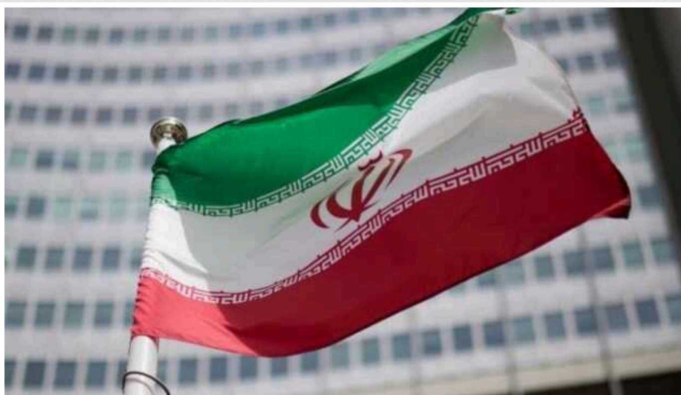
В Ірані визначилися з кандидатами у президенти

Рада опікунів Ірану у неділю визначила шістьох кандидатів, яким буде дозволено брати участь у президентських виборах 28 червня, призначених після загибелі Ібрагіма Раїсі.