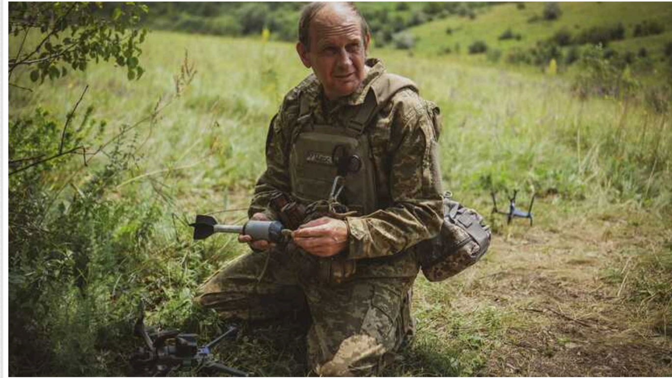
На Сіверському напрямку прикордонники дронами знищили одразу 15 окупантів

ДПСУ оприлюднила відеозапис, на якому видно, як вправно українські захисники керують FPV-дронами та влучають у невеликого розміру окопні діри, де переховуються окупанти.