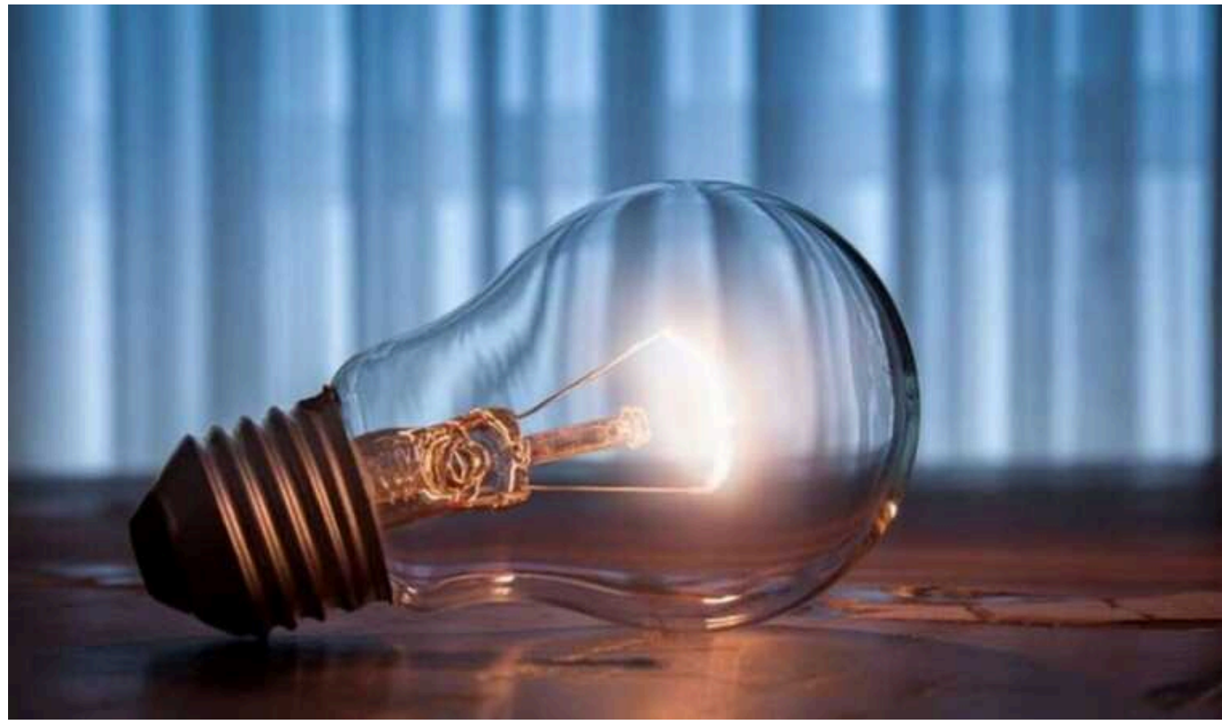
Стабілізаційні відключення в Україні розпочнуться на дві години пізніше

Стабілізаційні відключення в Україні розпочнуться сьогодні о 18:00 замість 16:00 через ситуацію в енергосистемі та продовжаться до 24:00, повідомляють ДТЕК та "Укренерго".