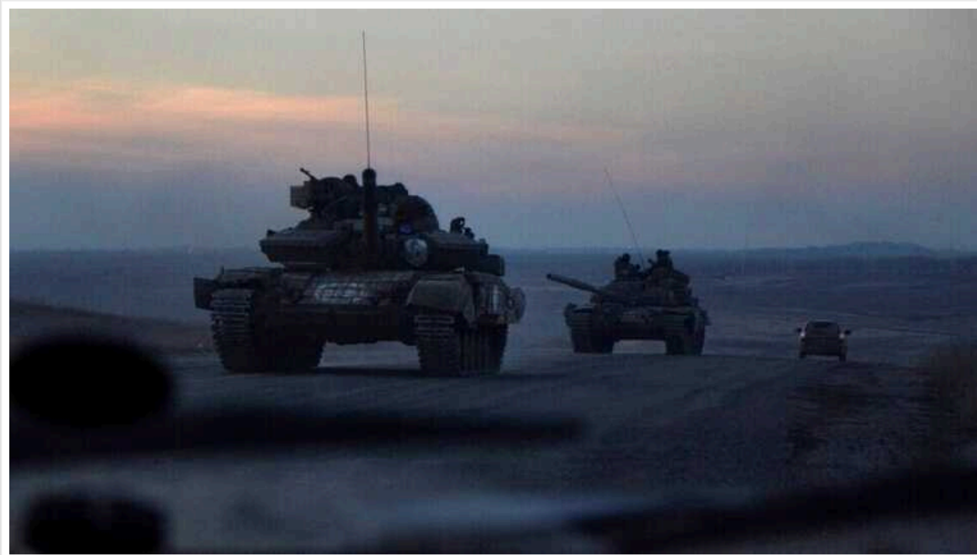
Українські прикордонники завадили окупантам облаштувати позиції на Сумському напрямку

Російська терористична армія продовжує облаштувати позиції на Сумському напрямку. У свою чергу, українські прикордонники перешкоджають спробам ворога наблизитися до державного кордону.