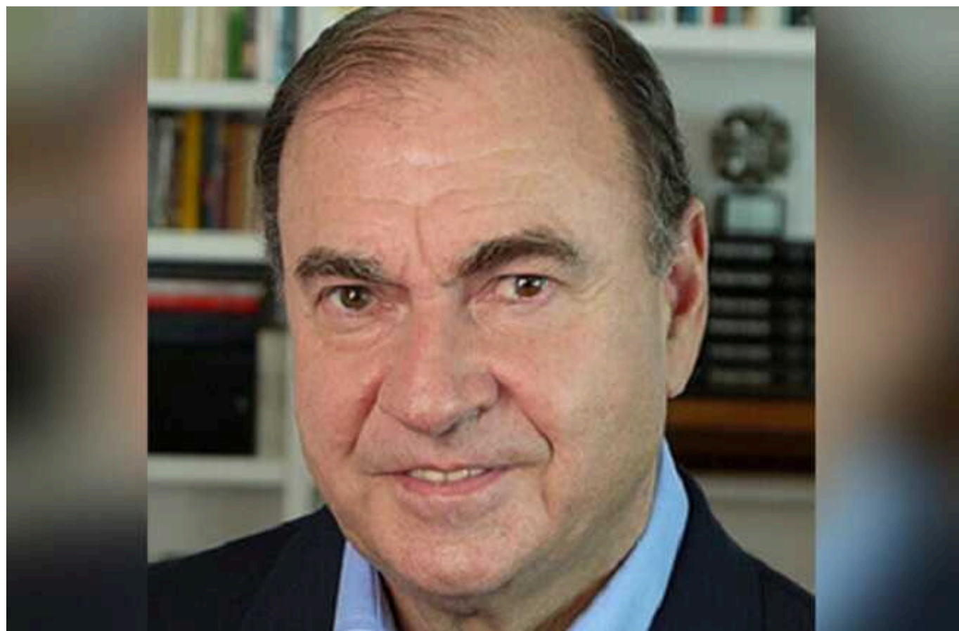
Колишній мер Ріо-де-Жанейро підключився до зборів мерії, сидючи на унітазі

Колишній мер Ріо-де-Жанейро мало не зірвав зборів мерії, підключившись до нього, сидючи на унітазі.