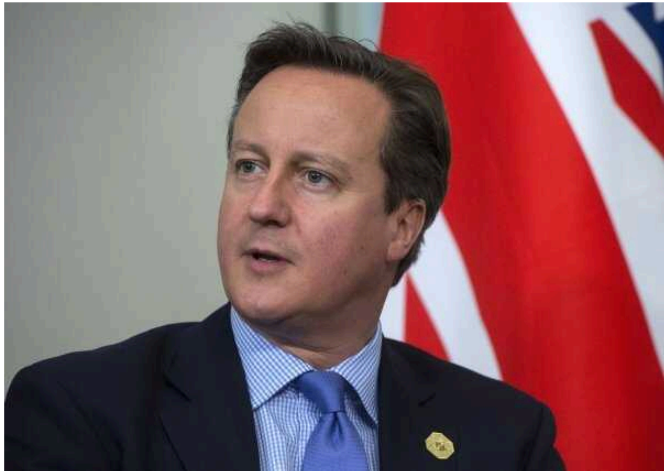
Глава МЗС Британії поспілкувався з пранкером, який видавав себе за Порошенка

Міністр закордонних справ Великої Британії Девід Камерон став жертвою розіграшу, коли йому зателефонували і представили колишнім Президентом України Петром Порошенком.