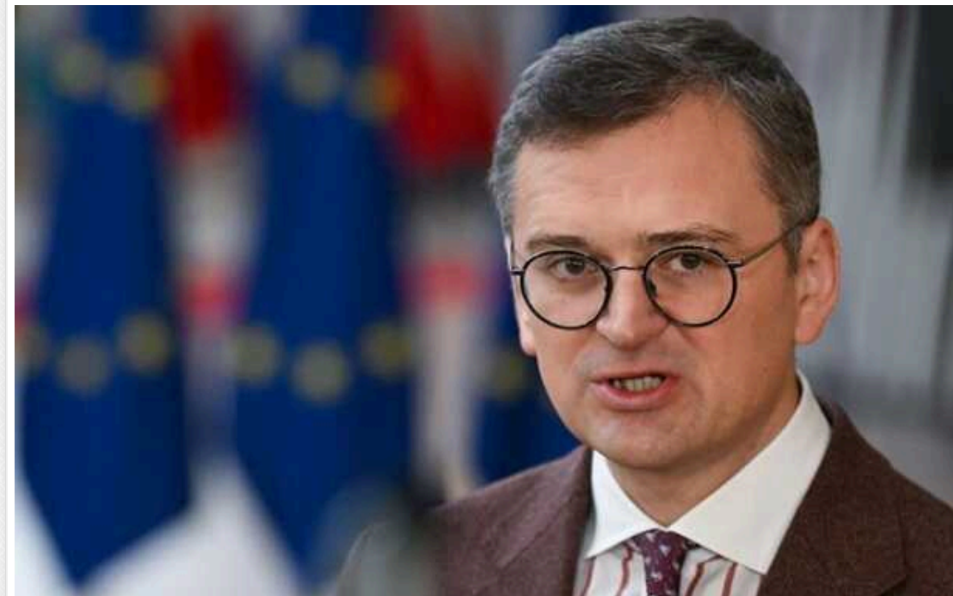
Кулеба: Через наближення Саміту миру в Москві панує істерична атмосфера

Наразі в Росії панують істеричні настрої через наближення Глобального саміту миру, оскільки на кону перебуває російський міф про поділ світу на Європу та Америку і решту світу.