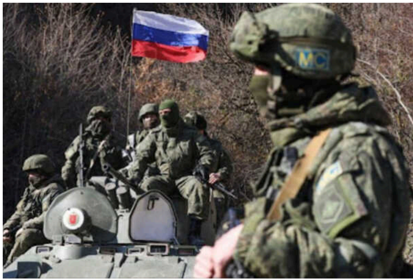
ISW: Путін сформулював «теорію перемоги» у війні в Україні

Ця теорія передбачає, що російські війська зможуть продовжувати поступовий наступ протягом невизначеного часу, не давши Україні провести успішні оперативні значущі контрнаступні операції та виграти війну на виснаження проти українських сил.