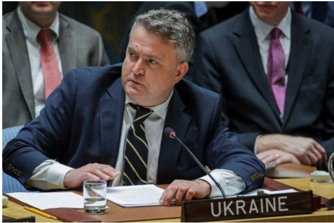
Кислиця закликав Радбез не називати війну «українською кризою»

Постійний представник України при ООН Сергій Кислиця наголосив, що називати війну Росії проти України "українською кризою" – це неправильно та неправомірно. Попри це, деякі члени Ради безпеки ООН досі продовжують давати саме таку назву аерсії РФ проти нашої держави.