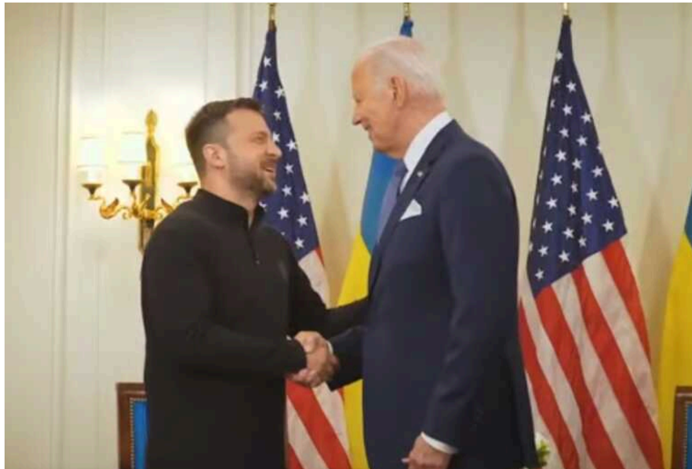
У Білому домі розповіли деталі перемовин Зеленського і Байдена в Парижі

Під час зустрічі у французькому Парижі 7 червня Президент України Володимир Зеленський поділився з лідером США Джо Байденом "дуже відвертою оцінкою ситуації на полі бою". Останній запевнив українського колегу у непохитності подальшої підтримки.