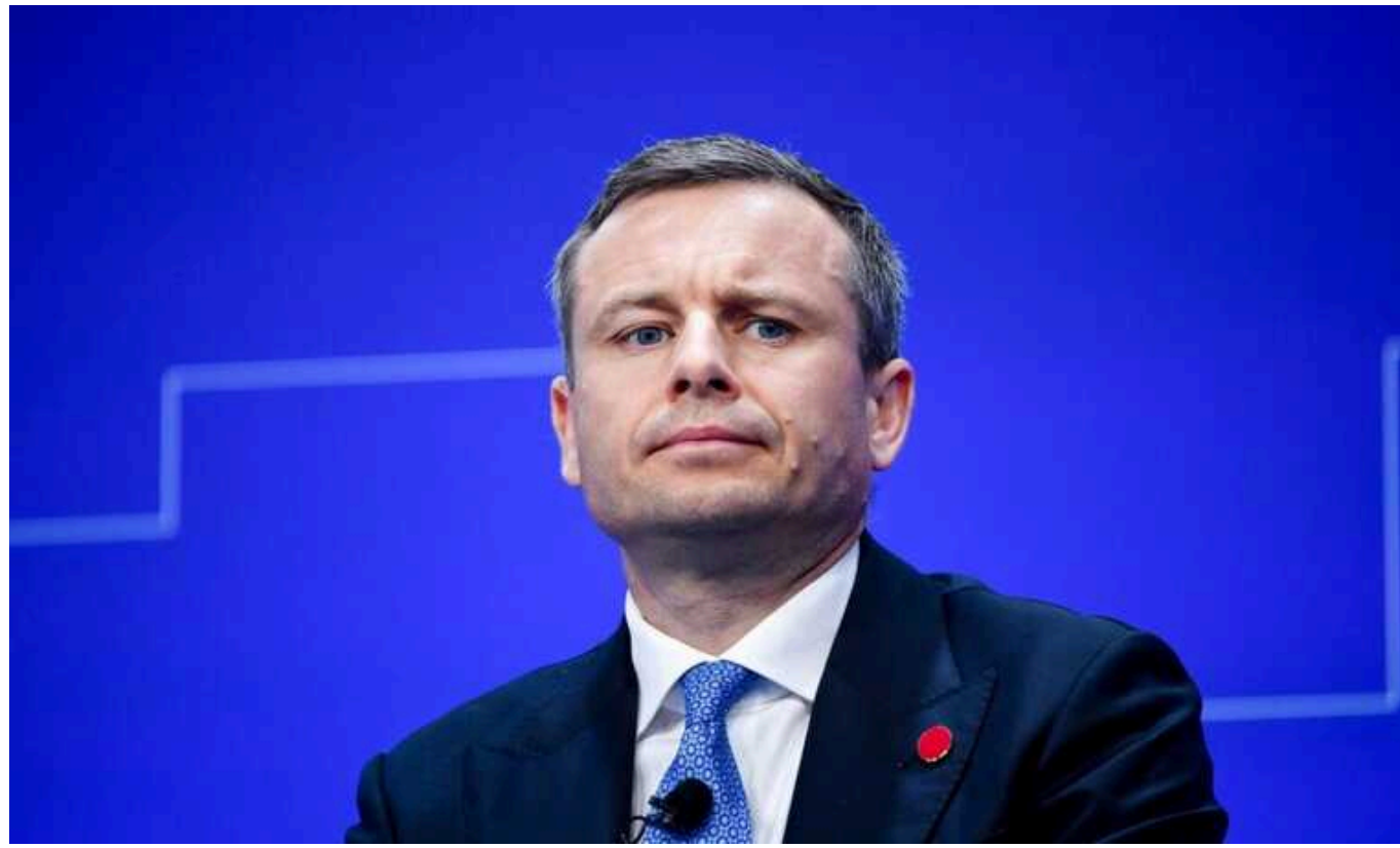
Мінфін: Україна очікує списання частини з 20 мільярдів доларів боргу

Уряд України веде переговори з утримувачами міжнародних облігацій про реструктуризацію свого боргу в 20 млрд доларів і обговорює його часткове списання.