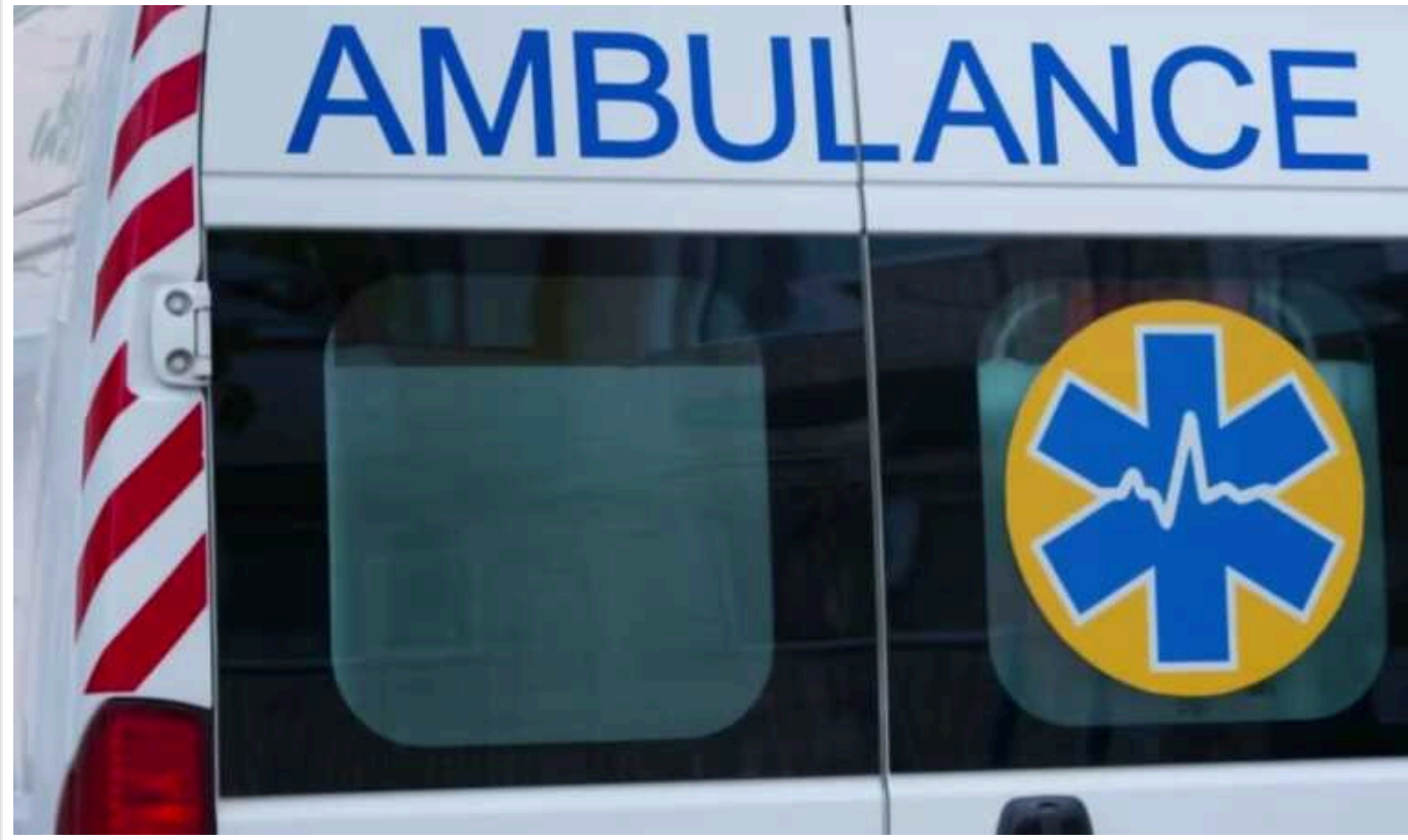
На Дніпропетровщині від російських обстрілів загинув 70-річний чоловік

Російська армія 7 червня обстріляла Нікопольський район на Дніпропетровщині. Унаслідок обстрілу загинув чоловік.