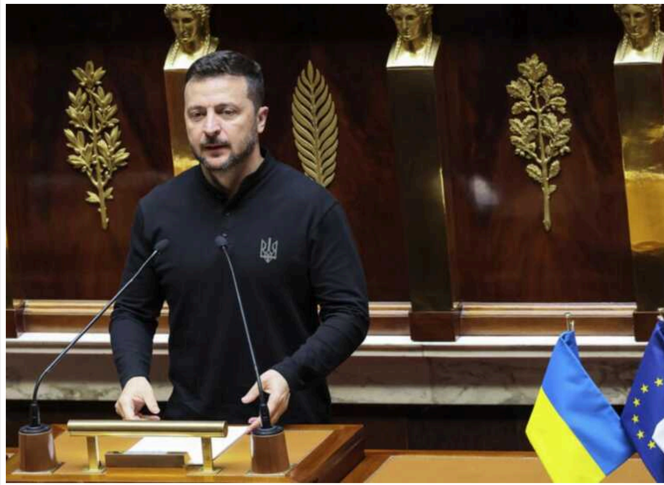
Politico: Зеленський перебуває у Франції з великою кількістю питань і деяким скептицизмом щодо західних партнерів

Видання зазначає, що «грандіозних обіцянок президента Джо Байдена підтримувати Україну до кінця недостатньо для Києва, який продовжуватиме підштовхувати США та інших своїх союзників робити більше, щоб допомогти повернути війну на користь України».