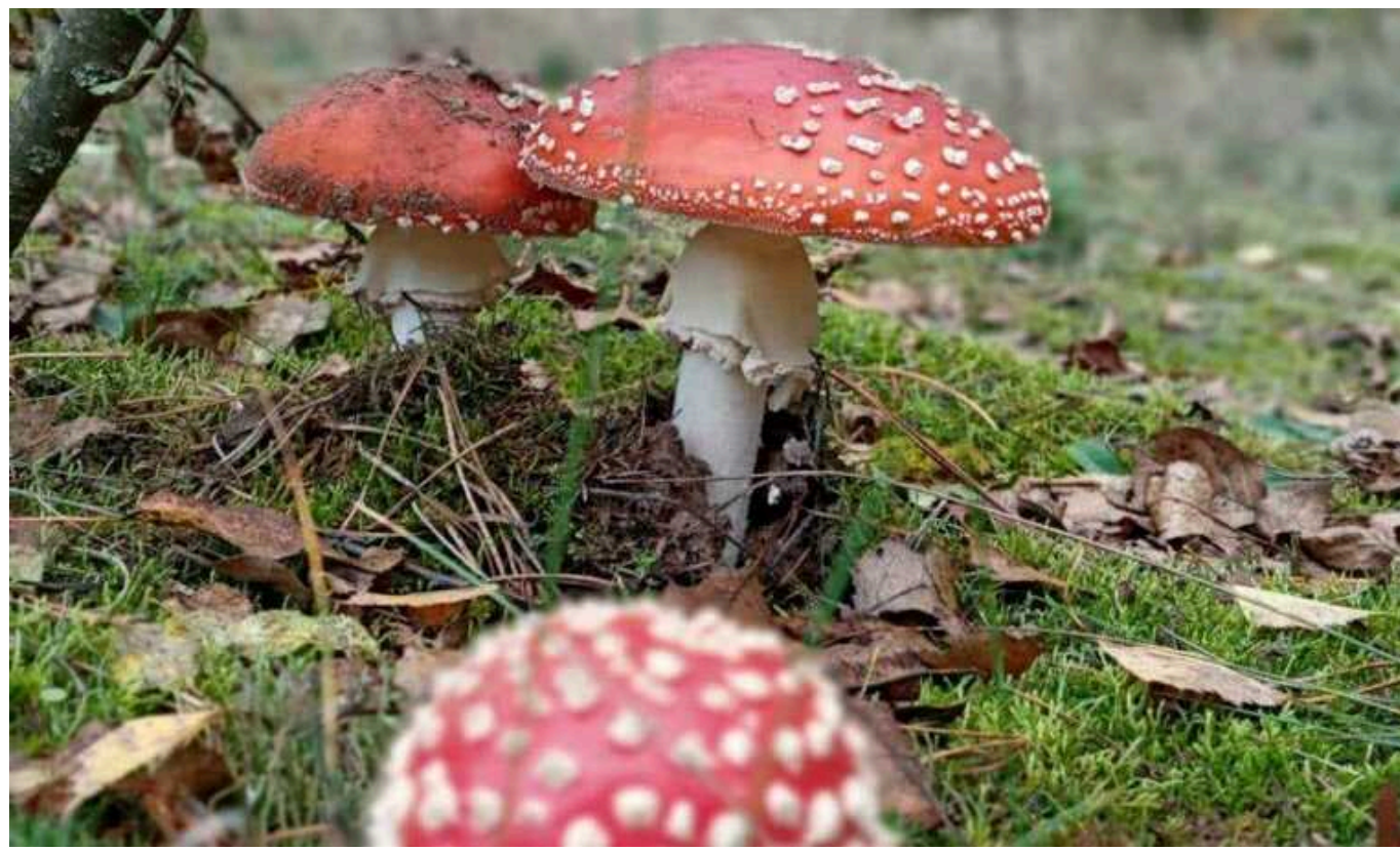
У Дрогобичі 26-річна мешканка отруїлася придбаними в інтернеті мухоморами

26-річна мешканка Дрогобиччини потрапила до лікарні з отруєнням після вживання сушених мухоморів, придбаних через інтернет. «Швидка» доставила жінку до лікарні, де лікарі провели їй деїнтотоксикаційну терапію.