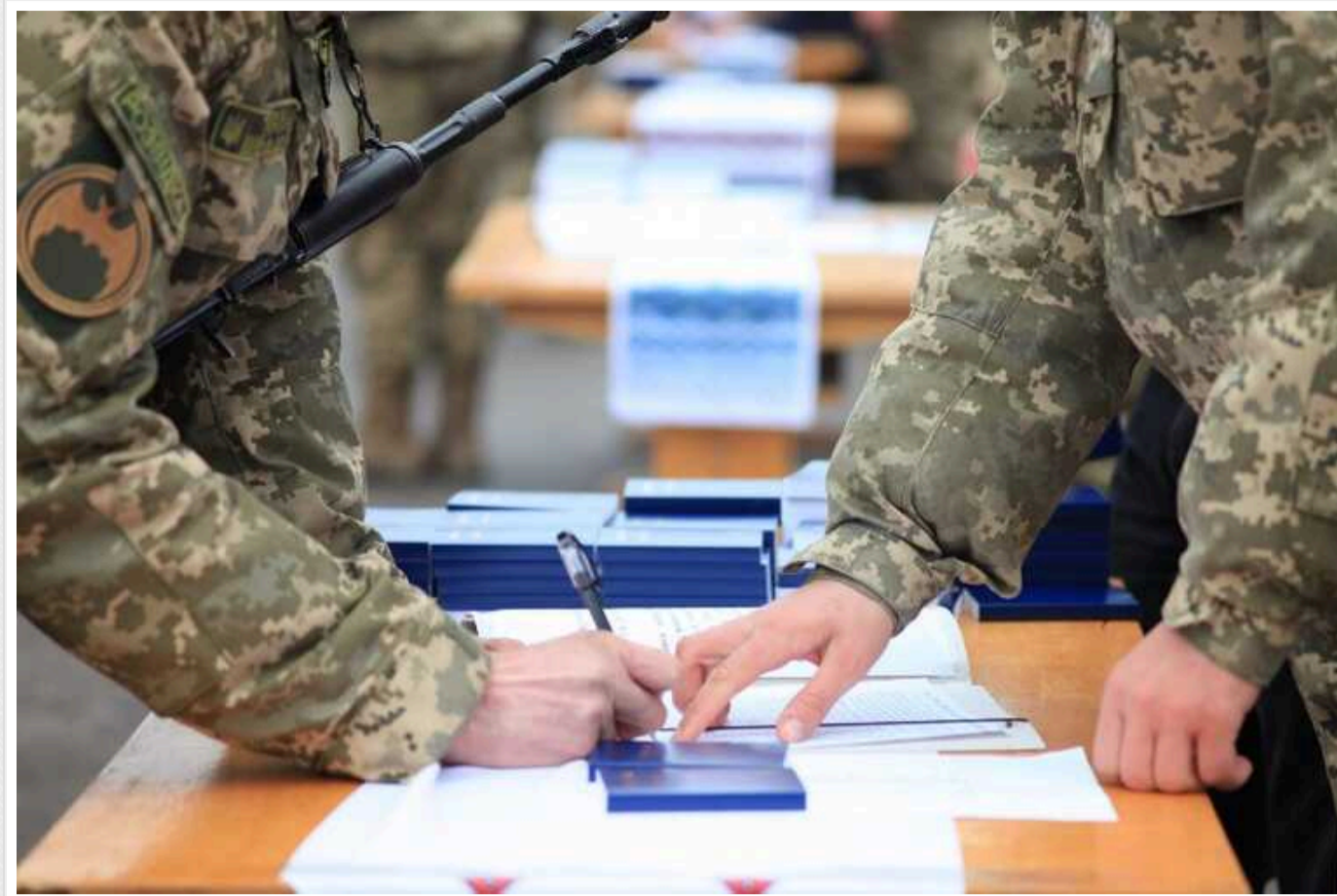
Дві категорії військовозобов'язаних можуть заключити контракт із ЗСУ на 1 рік навіть під час війни, — Міноборони