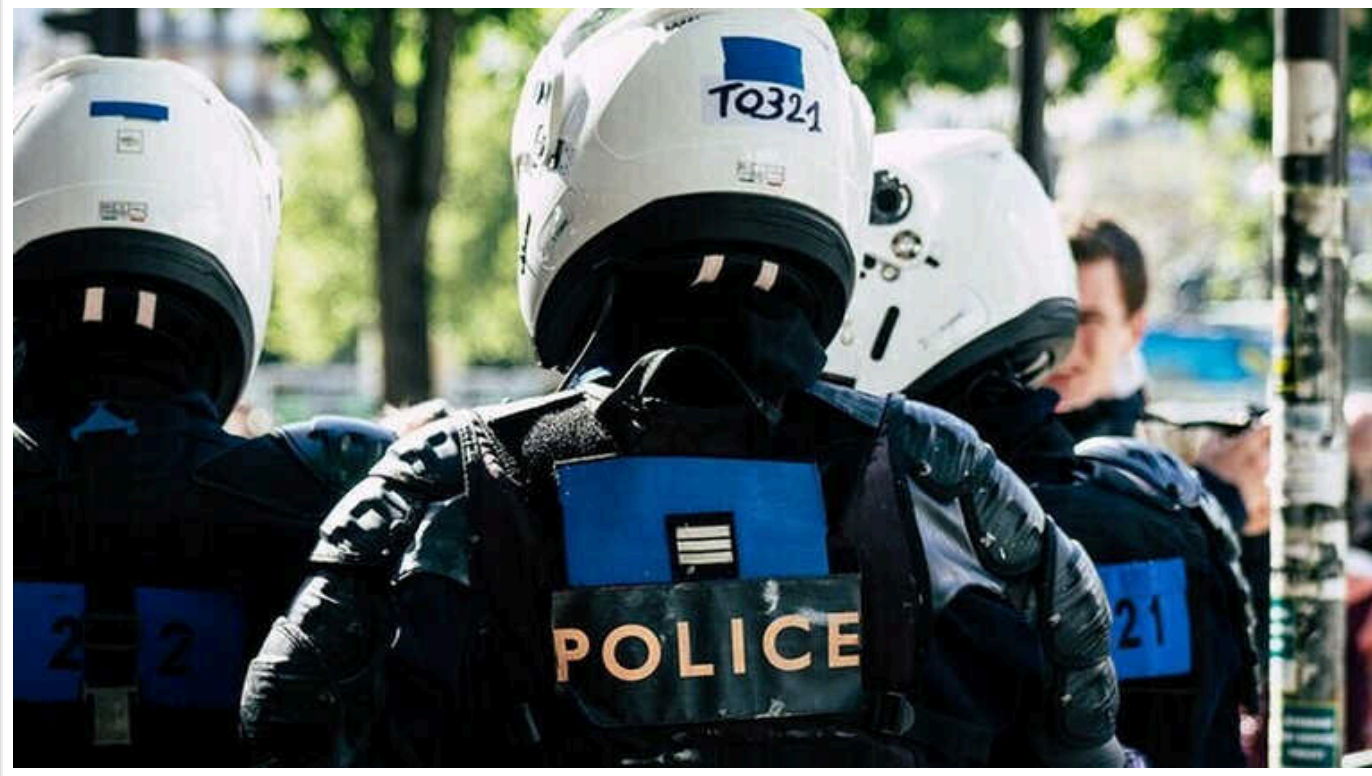
Уродженцю Донбасу, затриманому у Франції, інкримінують участь у підготовці теракту

Національна антитерористична прокуратура Франції 7 червня висунула затриманому цього тижня 26-річному уродженцю Донбасу планування насильницького нападу в межах терористичної змови.