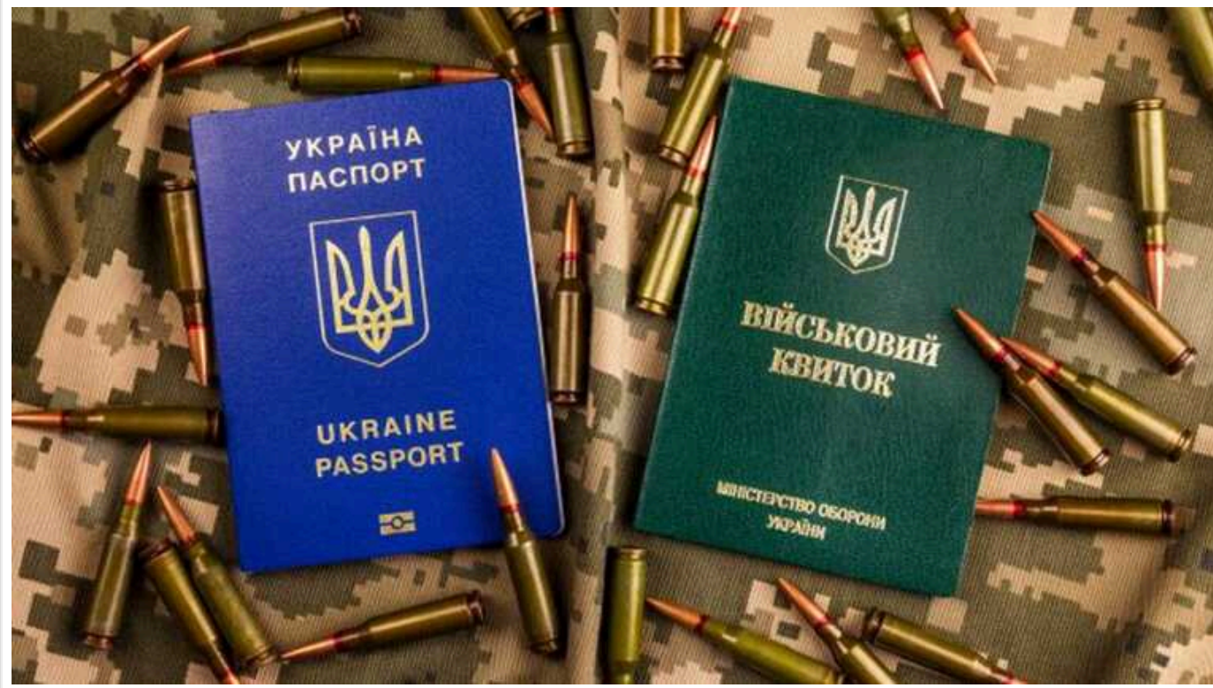
Бронювання від мобілізації тепер буде доступним через «Дію», – Федоров

Кабінет міністрів України підтримав ухвалу про бронювання військовозобов'язаних через портал "Дія".