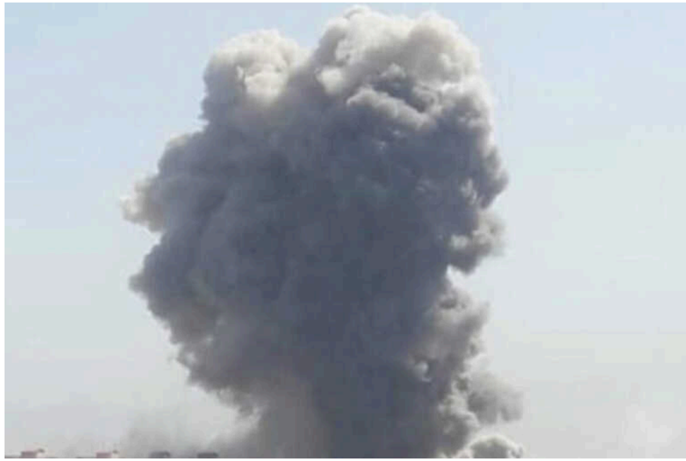
Луганська ОВА підтверджує удари по Луганську та заявляє, що ліквідовані російські військові та промислові об'єкти