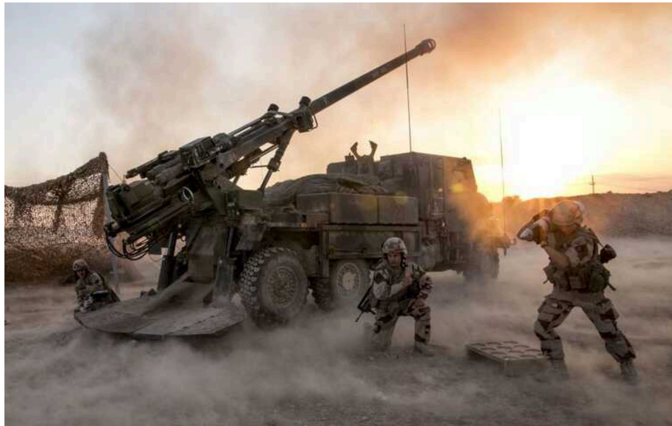
Концерн KNDS планує відкрити філію в Україні для виробництва САУ Caesar

7 червня французько-німецький концерн KNDS та українська компанія ENMEK підписали дві декларації про наміри, в одній з яких йшлося про створення центру технічного обслуговування САУ Caesar.