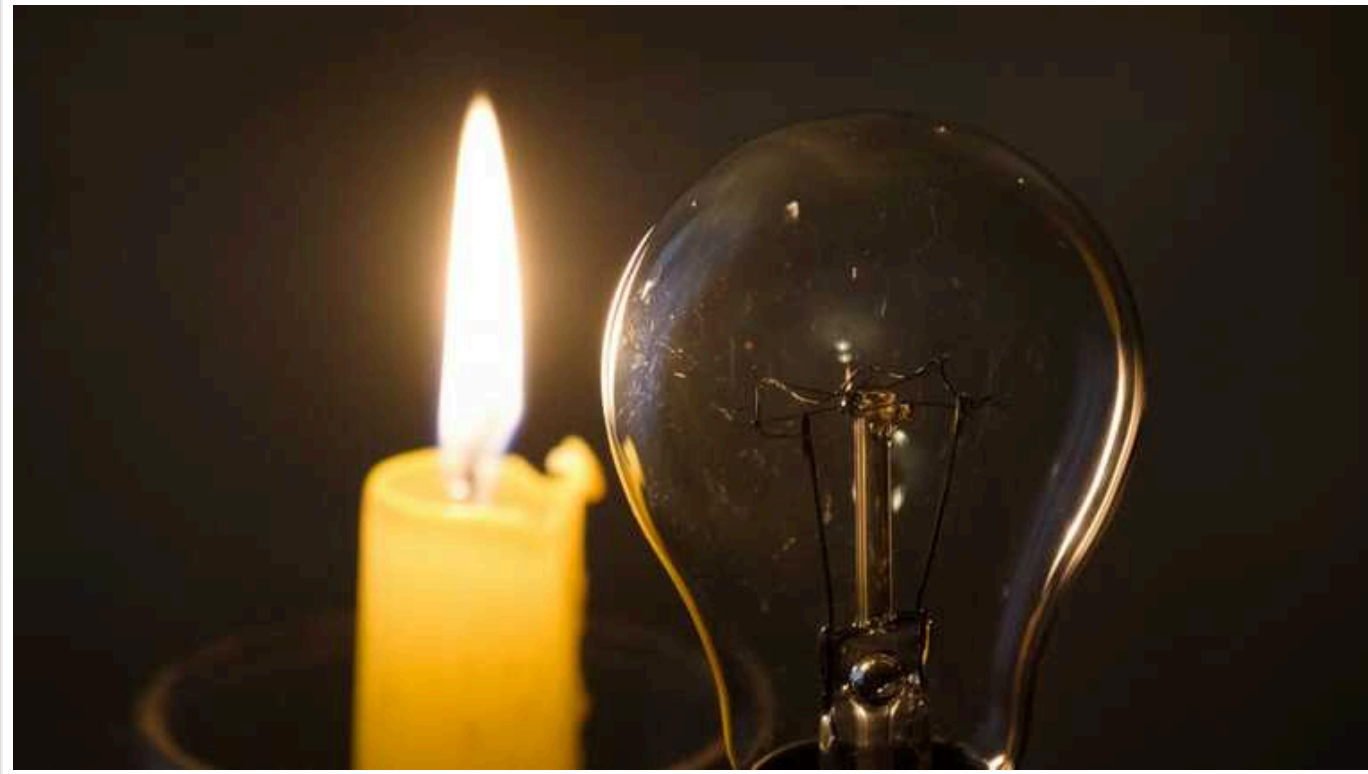
Українцям обіцяють більше світла через запровадження нового порядку застосування графіків відключень