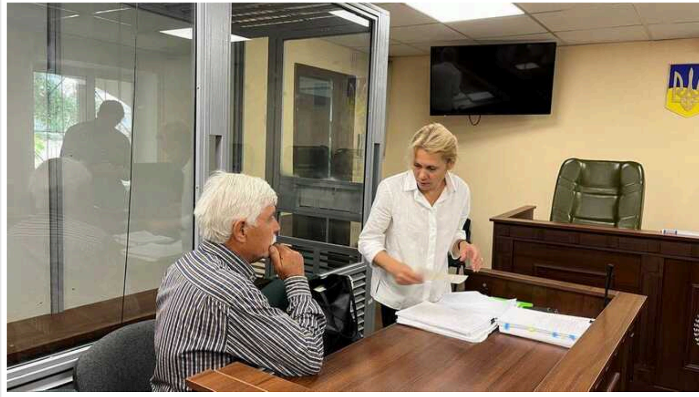
Київський райсуд відправив під цілодобовий домашній арешт пенсіонера, який ображав дівчину щодо мови

Дівчина заявляла, що при виході з підземного переходу двоє чоловіків звернулися до неї «у фамільярному та вульгарному тоні російською мовою».