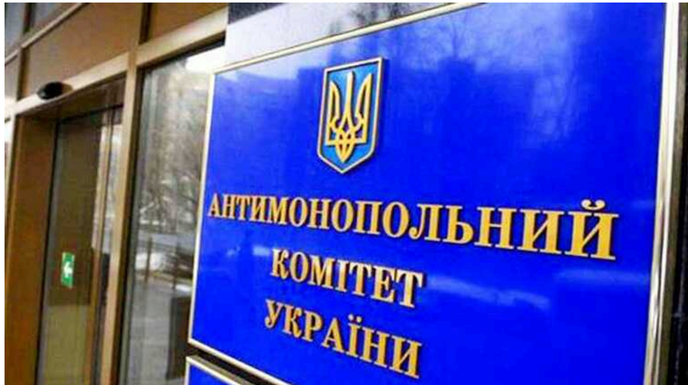
У Львові АМКУ викрив тендерну змову на закупівлю послуг з харчування для лікарні

Антимонопольний комітет викрив тендерну змову між двома учасниками аукціону під час закупівлі послуг з харчування для стаціонарних хворих лікарні у Львові.