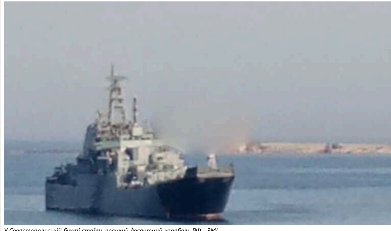
У Севастопольській бухті стоїть великий десантний корабель РФ, - ЗМІ

У тимчасово окупованому Криму, у Севастопольській бухті, стоїть російський великий десантний корабель 775.