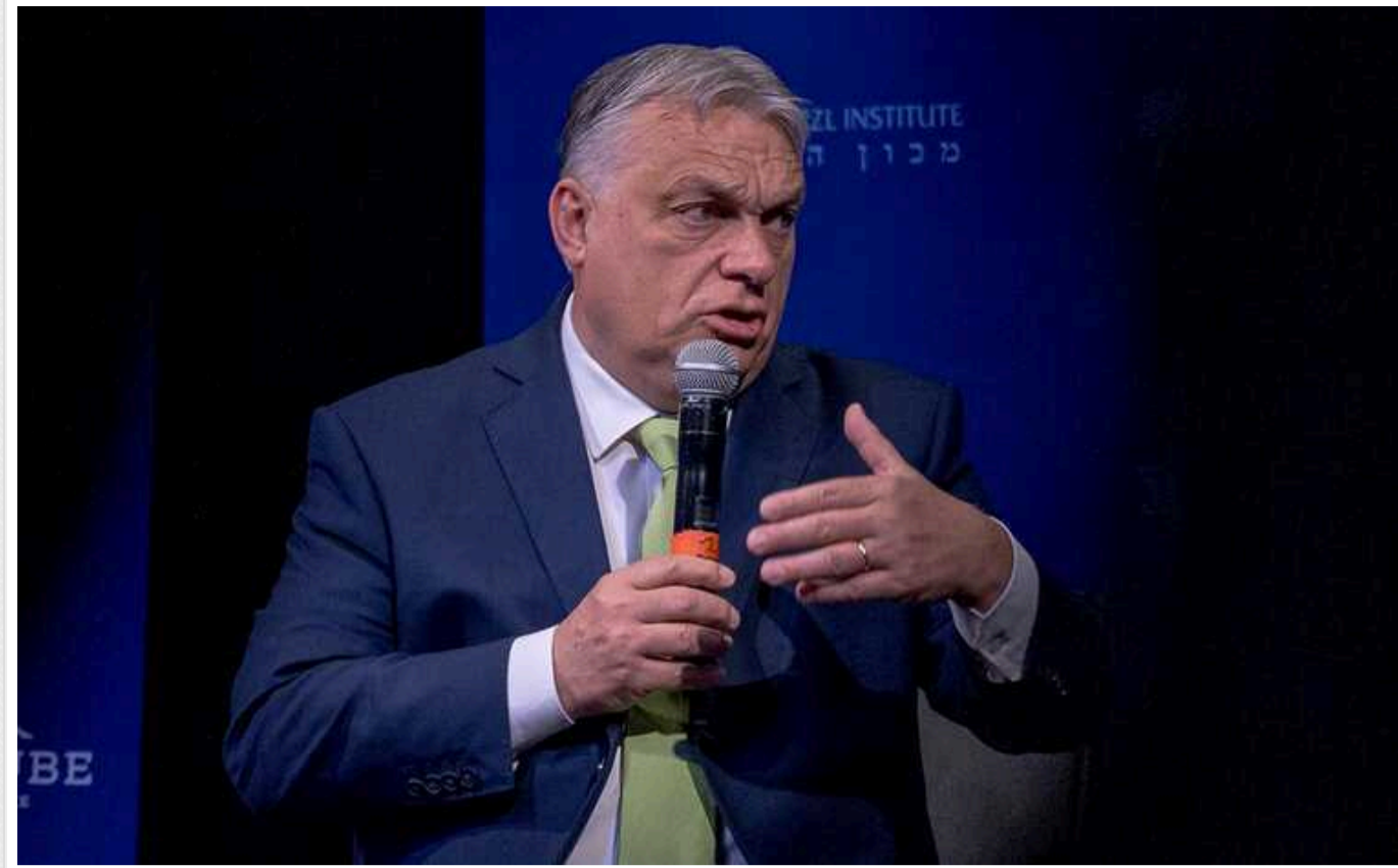
Орбан заявив про плани створення цього року "західної трансатлантичної мирної коаліції" для припинення війни в Україні

Прем'єр Угорщини вважає це можливим у разі перемоги Трампа та "хороших європейських виборів".