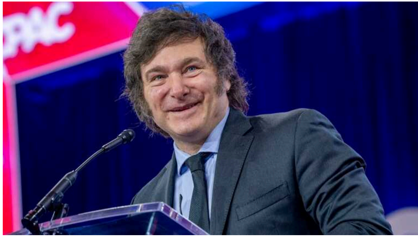
Президент Аргентини Хав'єр Мілей не браіме участі у Саміті миру в Швейцарії