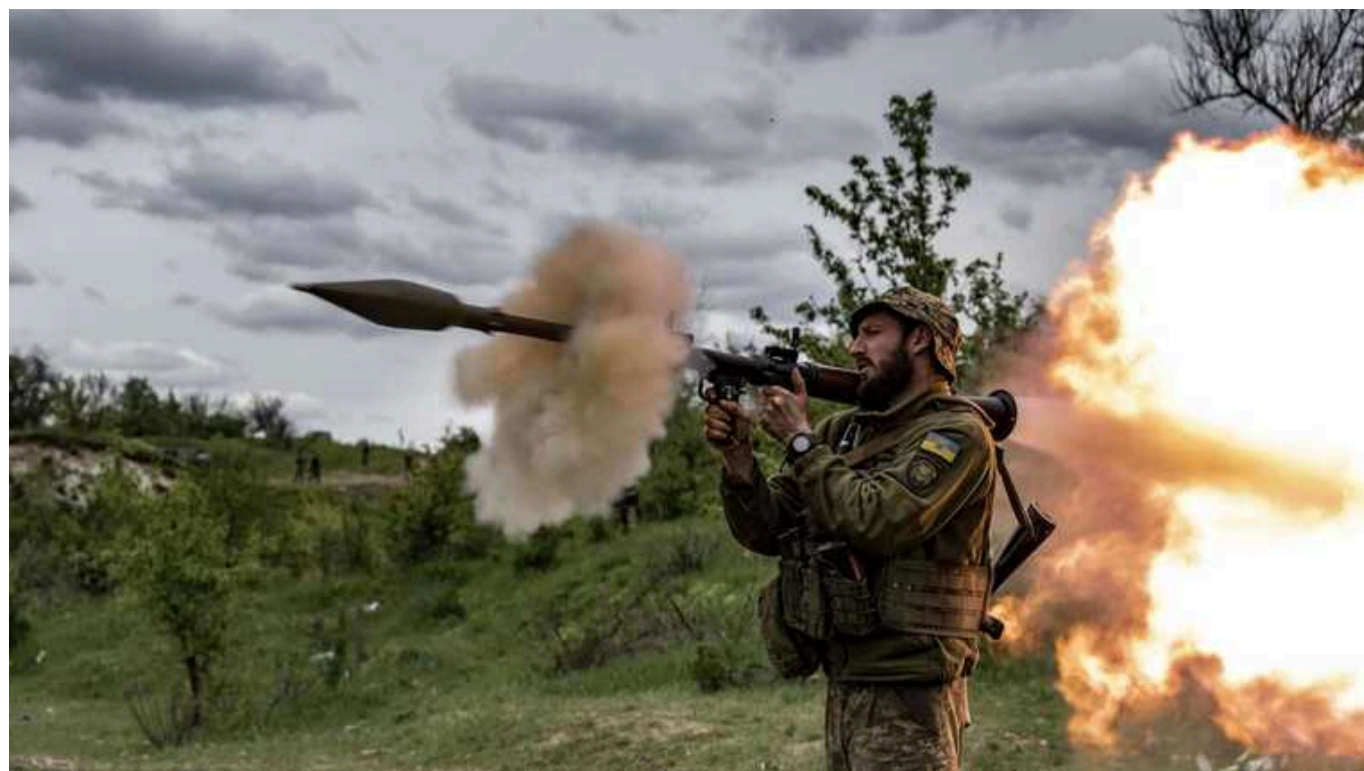
Ситуація на фронті: ворог 460 разів обстріляв позиції ЗСУ

Від початку доби, 7 червня, на фронті відбулось 24 бойових зіткнення. Ворог 460 разів обстріляв позиції наших воїнів та населені пункти.