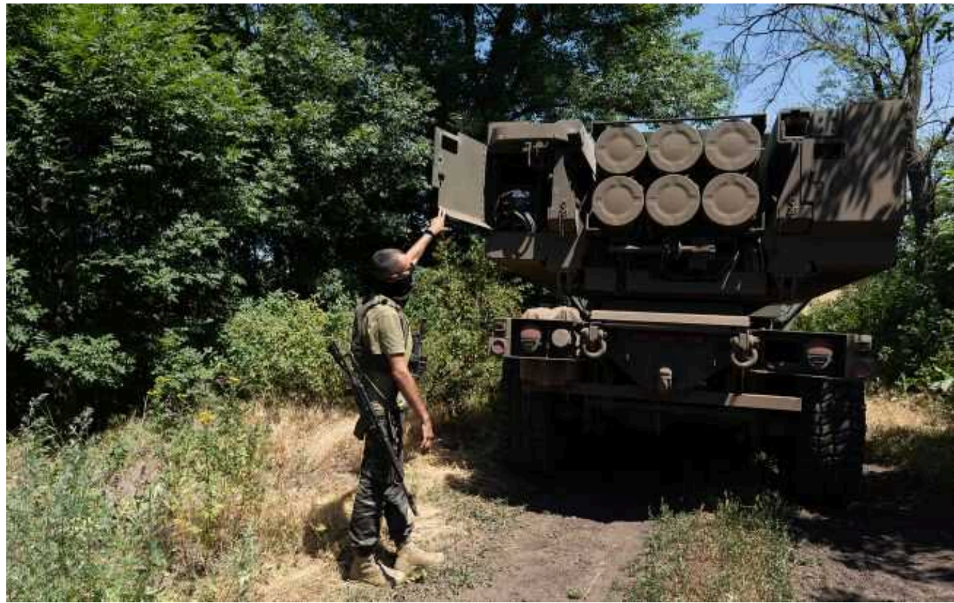
Бійці ССО завдали удару з HIMARS по розташуванню росіян на півдні

Українські військові вдарили по розташуванню окупантів на півдні України. Удар HIMARS по "жирній" цілі навели бійці Сил спецоперацій.