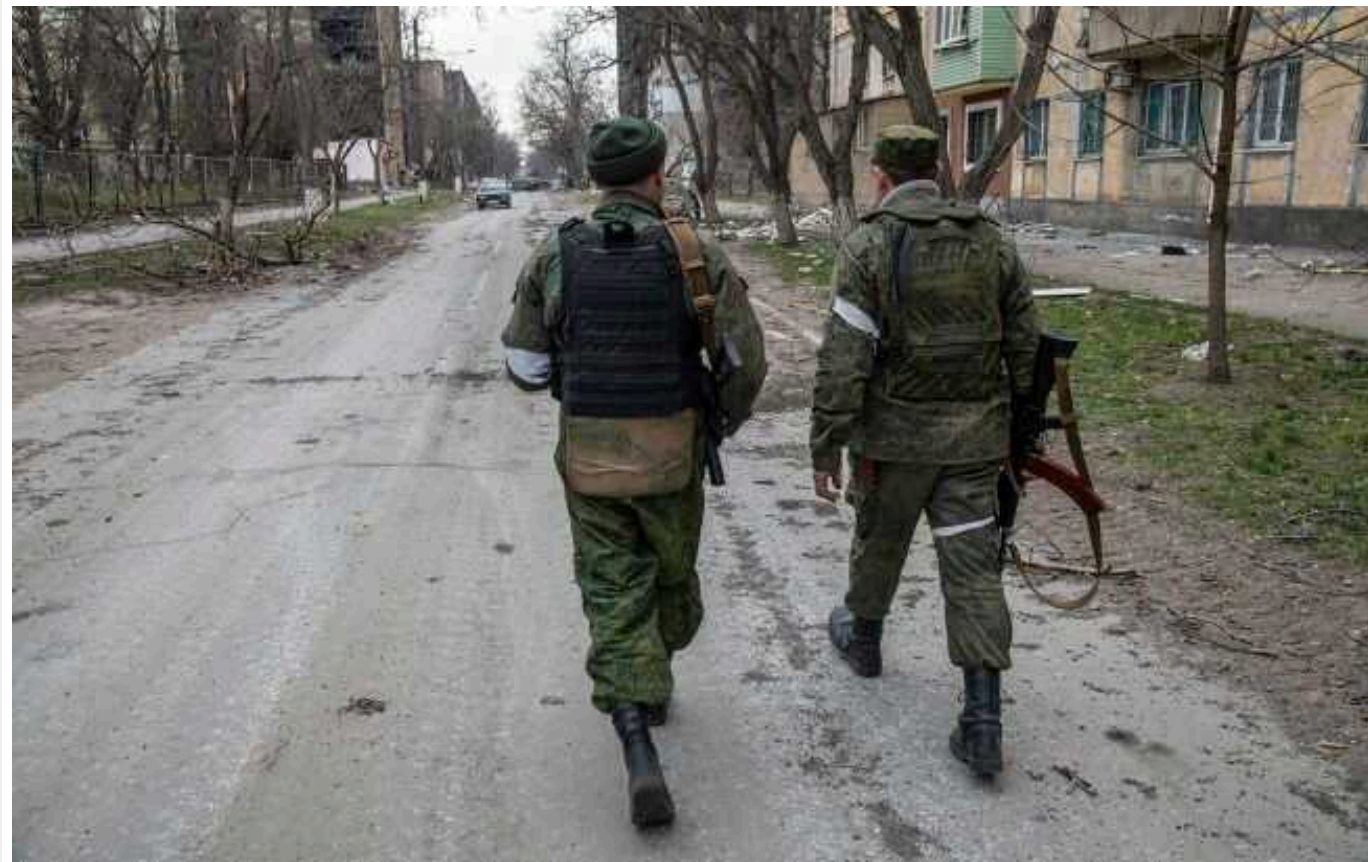
В ЦНС повідомляють, що окупанти почали готувати «судових приставів» на окупованій території Херсонщини

Російські воєнні злочинці продовжують розбудовувати репресійні вертикалі на тимчасово окупованих територіях Херсонської області. Нещодавно вони почали готувати так званих "судових приставів".