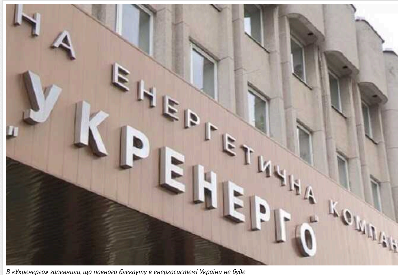
В «Укренерго» запевнили, що повного блекауту в енергосистемі України не буде

У компанії повідомили, що не варто плутати блекаут із контрольованими відключеннями, оскільки, на відміну від них, робота системи не контролюється "Укренерго".