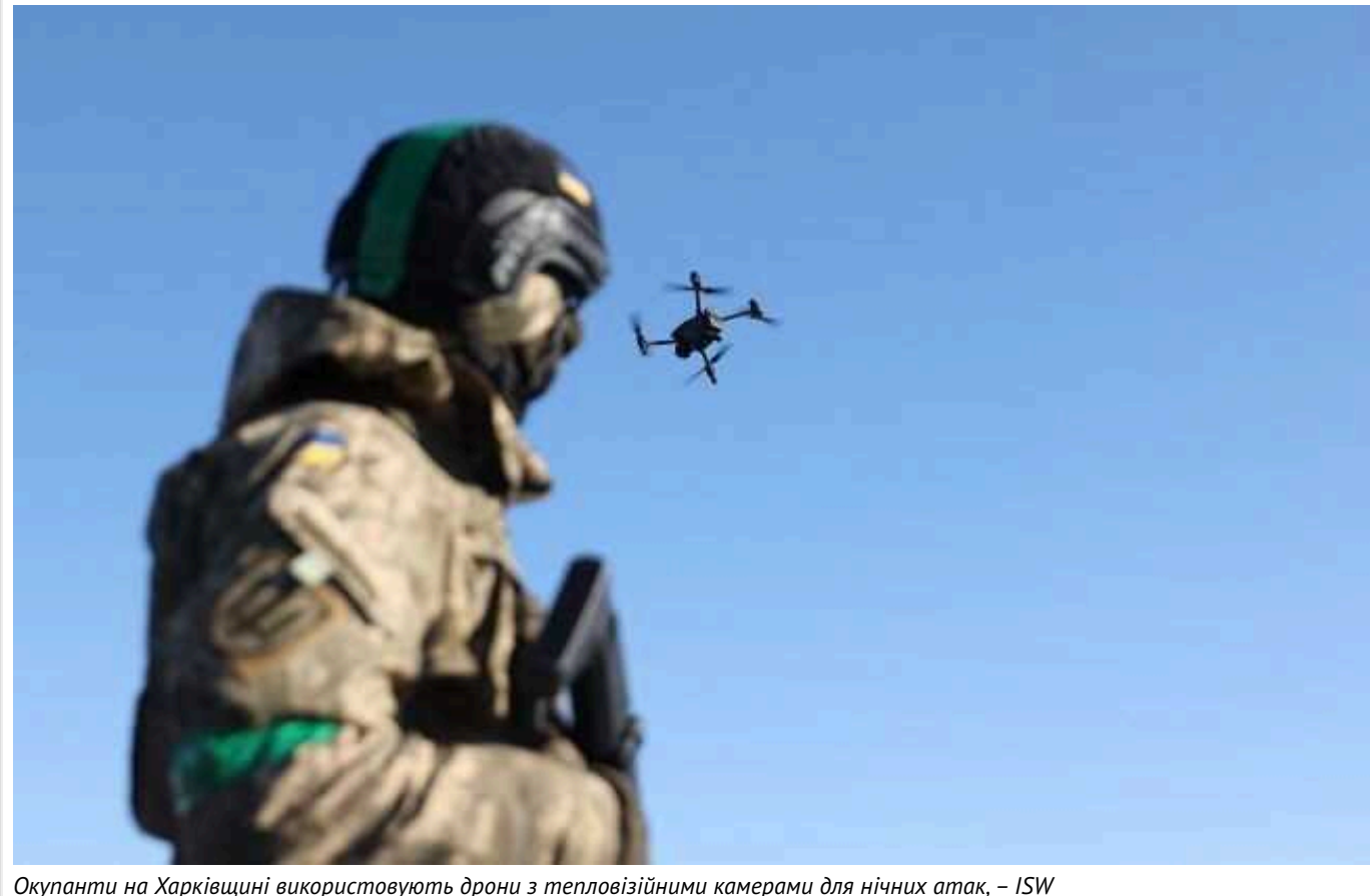
Окупанти на Харківщині використовують дрони з тепловізійними камерами для нічних атак, – ISW

Окупаційні війська РФ проводять часті атаки на півночі Харківської області, але пускаючи у бій обмежену живу силу. Натомість вони використовують FPV-дрони з тепловізійними камерами, щоб штурмувати українські позиції вночі.