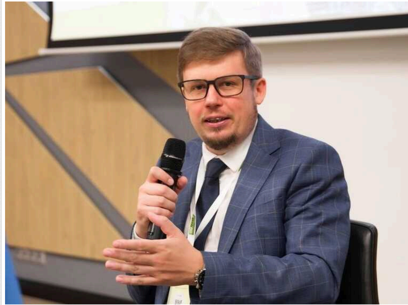
Уряд планує збільшити ліміти електроенергії для Києва та деяких міст

Найближчим часом Уряд прийме рішення, яке дозволить збільшити ліміти електроенергії для Києва та міст, де найбільше критичної інфраструктури.