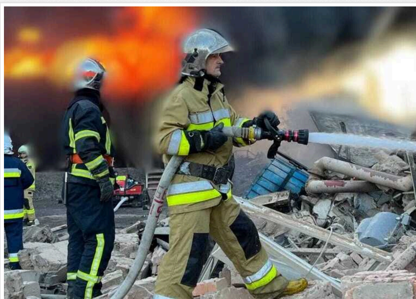
На Київщині внаслідок ворожої атаки виникла пожежа на промисловому об'єкті: у ДСНС використовують пожежний потяг

У Київській області під час російського повітряного нападу загорівся промисловий об'єкт. На щастя, минулося без постраждалих.