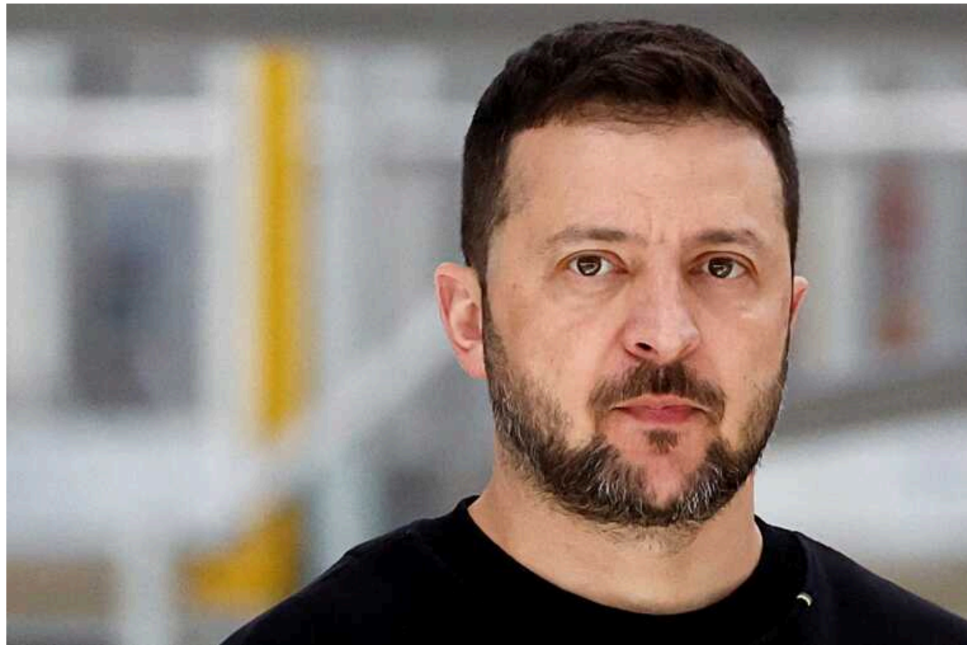
Наступного тижня Зеленський відвідає Німеччину та виступить у Бундестазі

Президент України Володимир Зеленський наступного вівторка, 11 червня, прибуде до столиці Німеччини Берліну і, під час візиту, має виступити з промовою у Бундестазі.