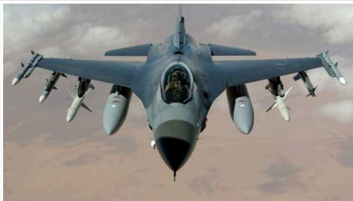
В ISW вказали на нюанс з використанням F-16 на війні в Україні

Західні партнери планують передати Україні понад 60 винищувачів F-16 вже влітку 2024 року. Однак застосовувати ці літаки Україна зможе обмежено.