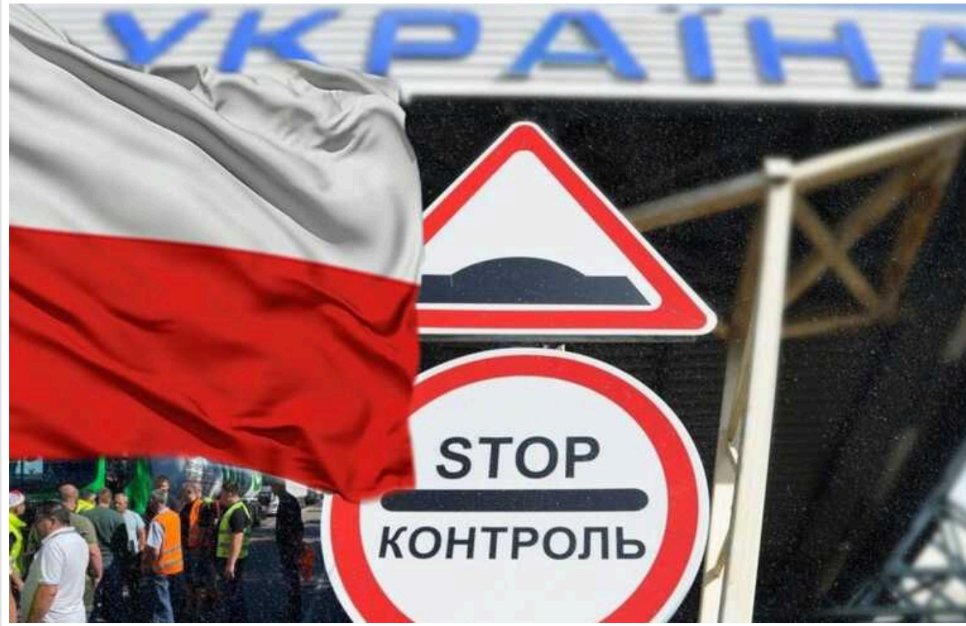
Польські фермери планують закінчити блокаду в ніч проти 7 червня, - ДПСУ