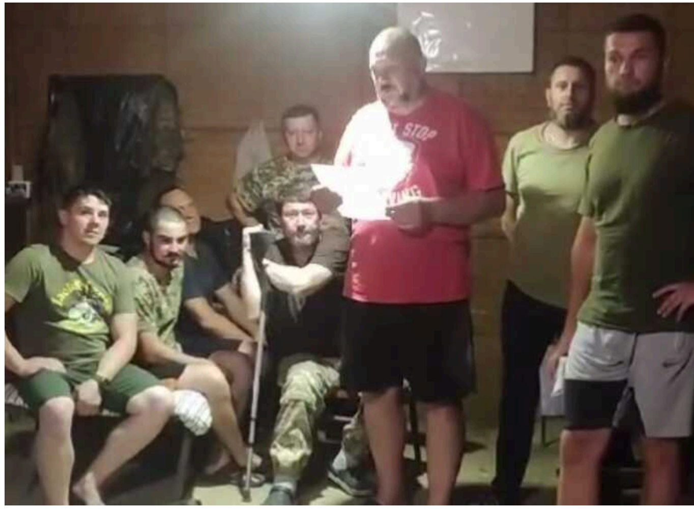
55 військових, які не придатні до служби по інвалідності, утримують у підвалі 81 ОАембр ДШВ

Крім цього, військовим не платять зарплати.