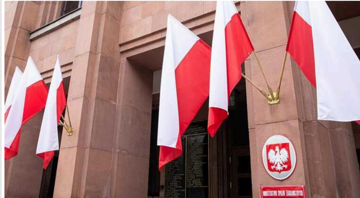
У МЗС Польщі вимагають у Білорусі видати вбивцю польського прикордонника