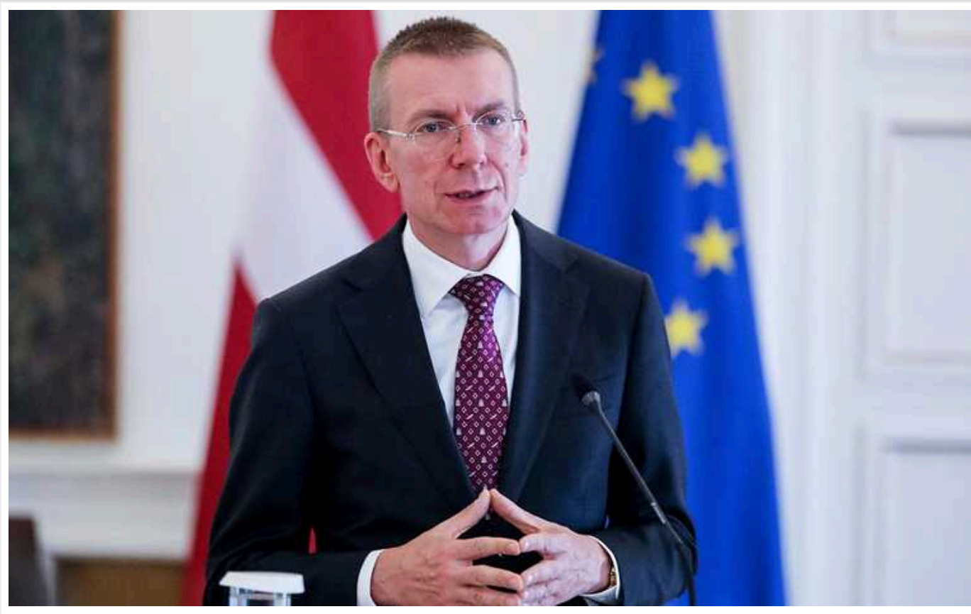
Перемога України у війні - її членство в Євросоюзі і НАТО, - президент Латвії Рінкевич

Президент Латвії Едгарс Рінкевич вважає, що перемога України передбачає членство країни в Європейському Союзі та НАТО.