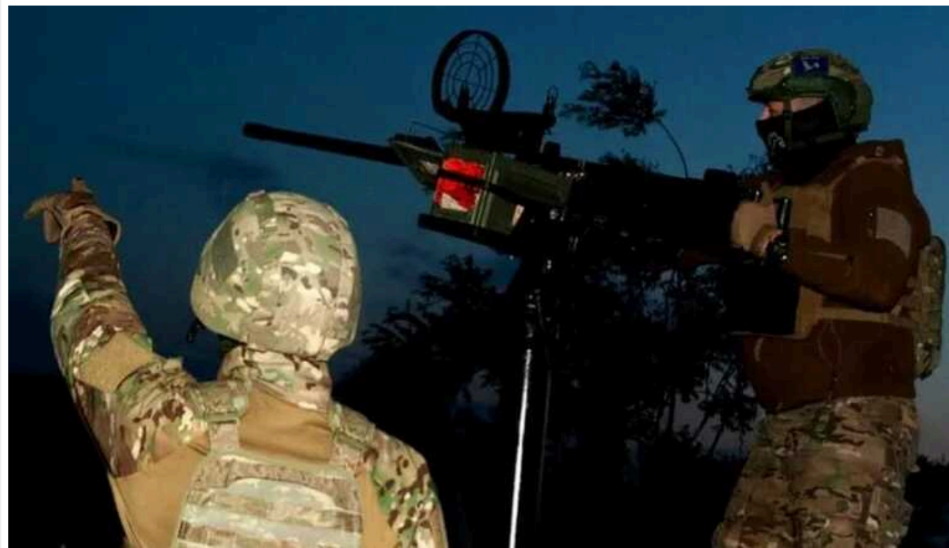
Україною шириться повітряна тривога: росіяни запустили "Шахеди"

Російські окупаційні війська ввечері в четвер, 6 червня, знову запустили Україною ударні дрони-камікадзе типу Shahed 136 з південного напрямку. У деяких регіонах на півдні було оголошено повітряну тривогу.