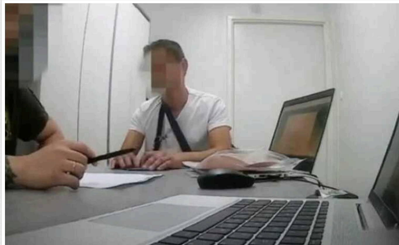
Прикордонники на кордоні з Польщею затримали фіктивне подружжя

У пункті пропуску «Краківець» на кордоні з Польщею затримали 20-річну жінку з інвалідністю з Дніпропетровщини, яка хотіла заробити на вивезенні ухлялянта, уклавши з ним фіктивний шлюб. Коли ж пару викрили на кордоні, вони спробували підкупити прикордонників.