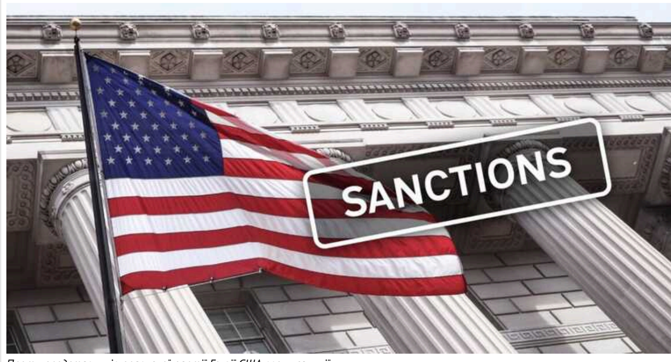
Проти представників правлячої партії Грузії США ввели санкції

США оголосили про введення візових санкцій проти десятків громадян Грузії, які представляють правлячу партію в парламенті, а також правоохоронні органи та членів їхніх сімей, через утиски демократії в країні та запровадження закону «про іноагентів».