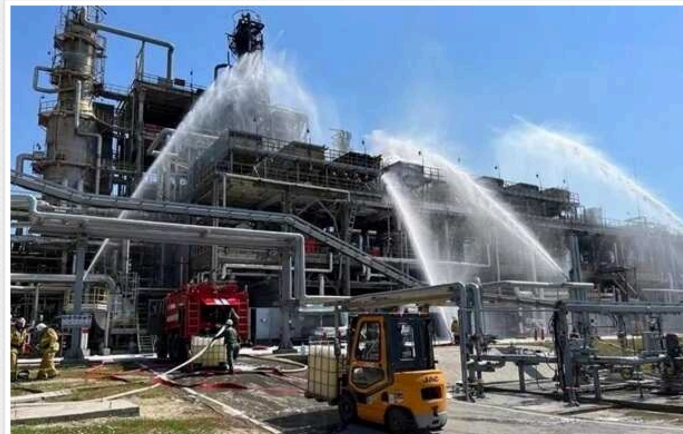
ЗМІ показали супутникові знімки наслідків атаки на Новошахтинський НПЗ у Ростовській області РФ

Новошахтинський нафтопереробний завод у Ростовській області був пошкоджений атакою дронів у ніч проти 6 червня.