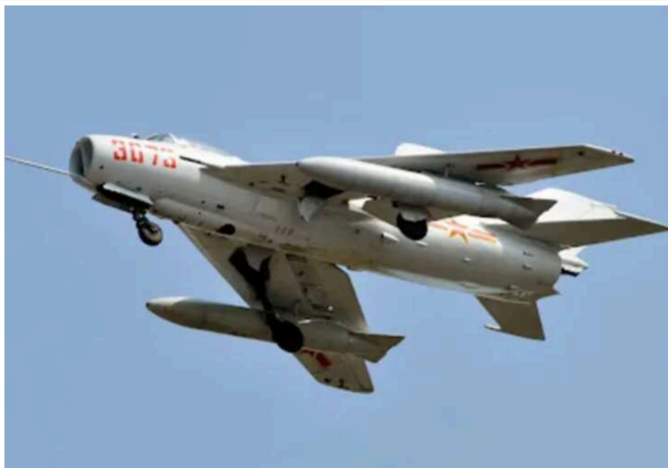
КНР агресивно вербує західних пілотів винищувачів

КНР активізувала зусилля з вербування західних військових пілотів, як колишніх, так і чинних. Для цього Народно-визвольна армія Китаю використовує приватні компанії, включаючи корпоративні рекрутингові служби, щоб "клієнти" якомога довше не розуміли, що мають справу з НВАК.